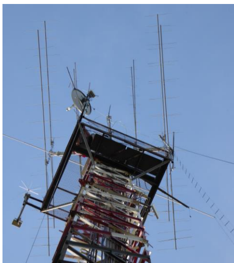
Vom Boden aus gesehen

An mehreren „Waldspielgruppen Tagen für Männer“ haben wir ein „H“ montiert und dieses dann bestückt mit: